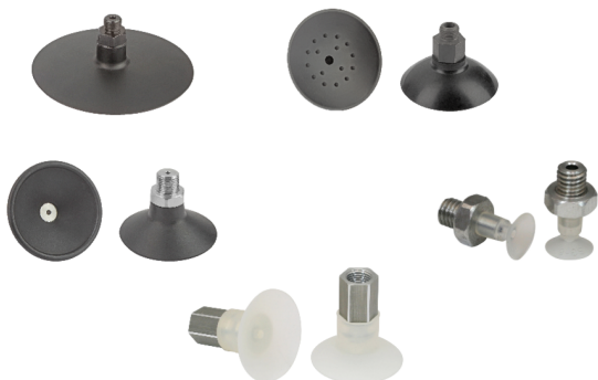
Плоские присоски SGN